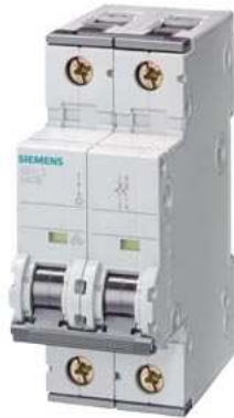
Leitungsschutzschalter 230V 6kA, 1+N-polig C, 6A, T=70mm