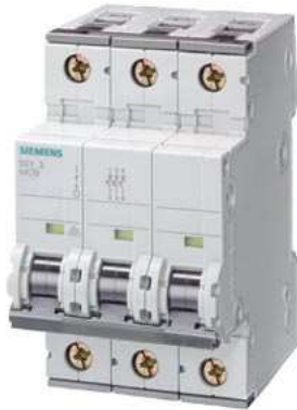
Leitungsschutzschalter 400V 6kA, 3-polig, C, 13A, T=70mm