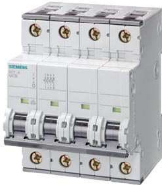
Leitungsschutzschalter 400V 10kA, 4-polig, D, 25A, T=70mm