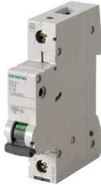
Leitungsschutzschalter 230/400V 10kA, 1-polig, C, 6A