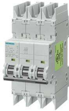
Leitungsschutzschalter 10kA, 3-polig, C, 40A nach UL 489-480Y/277V