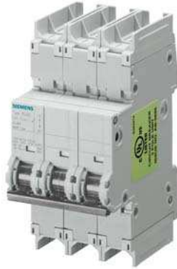
Leitungsschutzschalter 240V 14kA, 3-polig, C, 30A, T=70mm nach UL 489