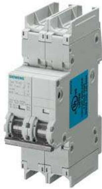
Leitungsschutzschalter 240V 14kA, 2-polig, C, 10A, T=70mm nach UL 489