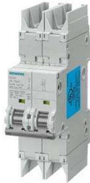
Leitungsschutzschalter 10kA, 2-polig, C, 0.5A nach UL 489-480Y/277V