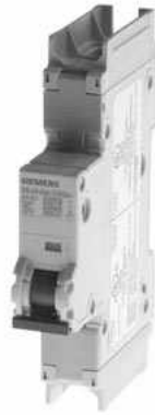
Leitungsschutzschalter 240V 14kA, 1-polig, D, 20A, T=70mm nach UL 489