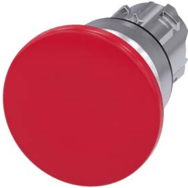
Pilzdrucktaster, 22 mm, rund, Metall, hochglanz, rot, 40 mm, tastend