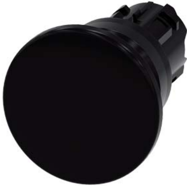
Pilzdrucktaster, 22 mm, rund, Kunststoff, schwarz, 40 mm, tastend