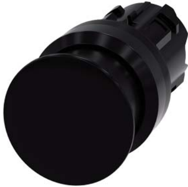
Pilzdrucktaster, 22 mm, rund, Kunststoff, schwarz, 30 mm, tastend