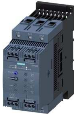
SIRIUS Sanftstarter S3 106 A, 55 kW/400 V, 40 °C AC 200-480 V, AC/DC 110-230 V Schraubklemmen