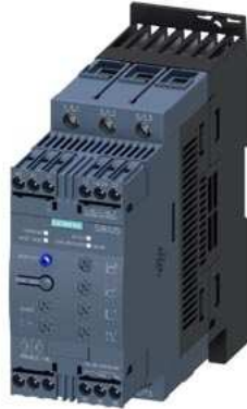
SIRIUS Sanftstarter S2 72 A, 37 kW/400 V, 40 °C AC 200-480 V, AC/DC 110-230 V Schraubklemmen