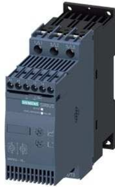
SIRIUS Sanftstarter S0 25 A, 11 kW/400 V, 40 °C AC 200-480 V, AC/DC 110-230 V Schraubklemmen