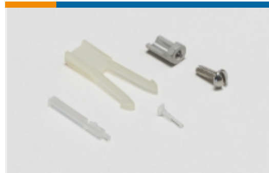
Kodierungen für Leiterplatten-Steckverbinder(2)