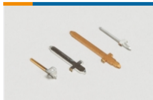
Leiterplatten-Steckverbinderkontakte in mehreren Konfigurationen(2)