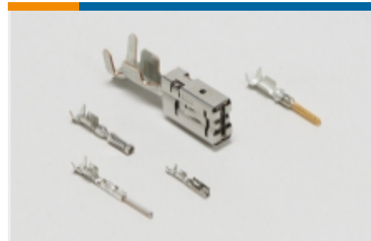
Kontakte für Pkw, Lkw, Busse und Off-Road-Fahrzeuge(5)