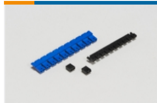
Leiterplatte-an-Leiterplatte-Jumper und -Brückenstecker(5)