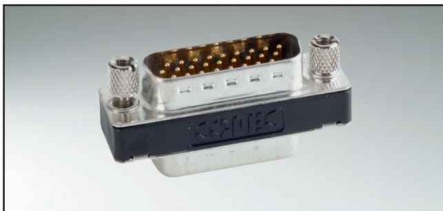
RoHS compliant – CSA listed, File No.: LR 115000-1 – UL listed, File No.: E202784

Buchsenleiste / Stiftleiste – gedrehte Kontakte – flache Bauform