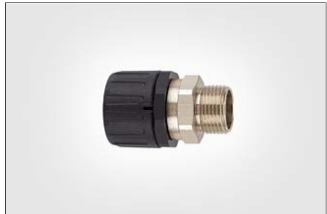
HelaGuard HG-SM gerade Verschraubung mit drehendem Messing-Außengewinde.