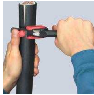
Drehen des Werkzeugs für Umfangsschnitt