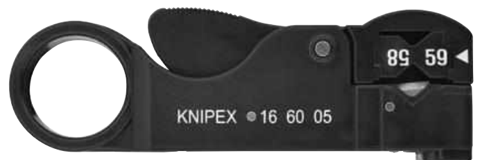
16 60 05 SB