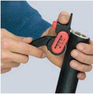
Ansetzen des Werkzeugs für Längsschnitt