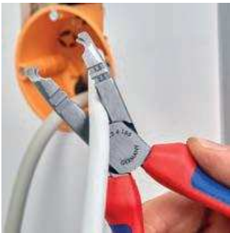
Schneiden von Kabeln bis Ø 13 mm