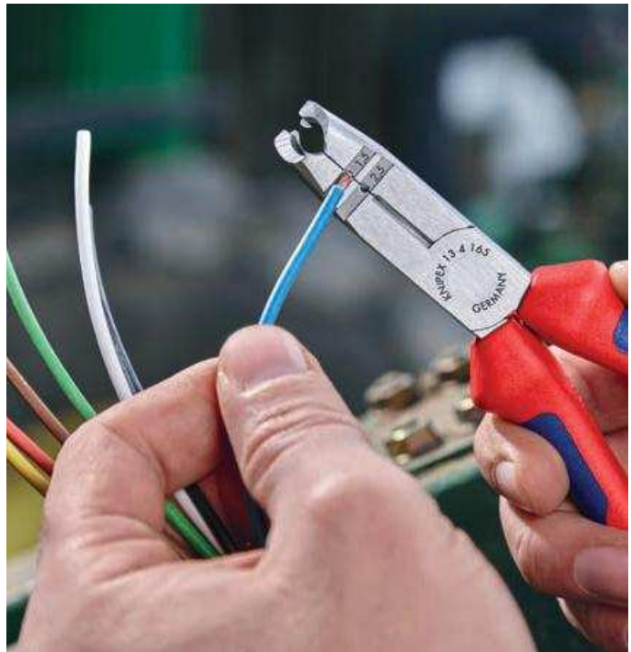
Abisolierlöcher für Leiter 1,5 und 2,5 mm 2