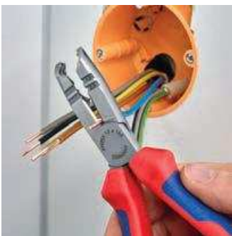
Schneiden beim Einkürzen von Einzelleitern