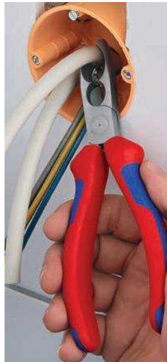
Abmanteln tief unten in der Unterputzdose