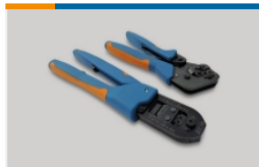
Outils de sertissage manuel(1)