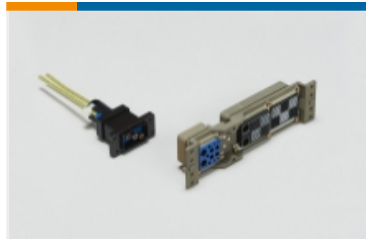
Connecteur pour racks et panneaux(1)