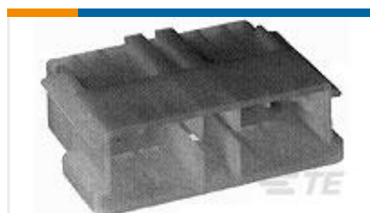
N° de pièce TE 142177-2 CAP HOUSING M.I.C 13 POS