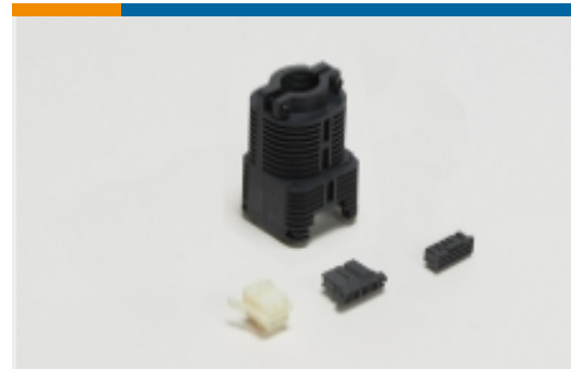
Boîtiers pour connecteurs rectangulaires(2)