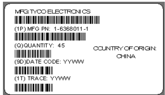
图 2 (only for 1-6368011-1/2)

---其中(9D)Date code及(1T)trace都是指日期, 格式是YYWW.